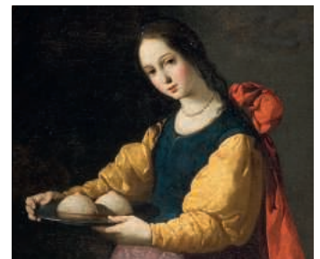
Der spanische Künstler Francisco de Zurbarán (1598–1664) malte die heilige Agatha mit ihren abgeschnittenen Brüsten.