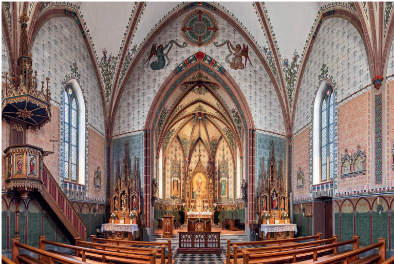
Ein Blick in die Pfarrkirche von Alpthal, wie er von blossem Auge nicht möglich wäre.