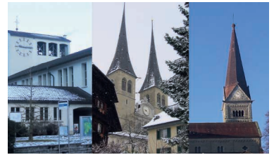
Die Kirchen von Littau, Luzern und Reussbühl gehören neu zum gleichen Pastoralraum.