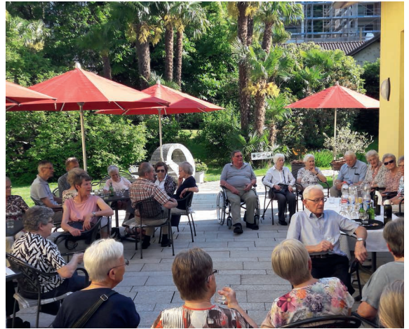
Apéro zum Ferienstart Juni 2019.