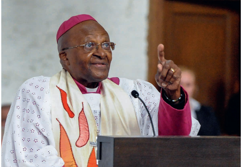
Ob wegen Hautfarbe, Nationalität oder sexueller Orientierung – Desmond Tutu wehrte sich gegen jede Form von Diskriminierung.

Nach dem Ende des Apartheid-Staates wurde Tutu Vorsitzender der «Kommission für Wahrheit und Versöhnung». In dieser Rolle, in der er sich selber als «Quälgeist» bezeichnete, hörte er Opfer und Täter*innen des Systems an – 20 000 Fälle der Jahre von 1960 bis 1994 wurden in drei Jahren untersucht. Dies brachte ihm auch Kritik des inzwischen regierenden Afrikanischen Nationalkongresses (ANC) ein, denn die Kommission hatte ohne Scheu auch die Folterungen, Attentate und Mordbefehle der Schwarzen-Organisation angeprangert. «Ich habe nicht mein Leben lang gegen Tyrannei gekämpft, um sie durch eine andere Form der Tyrannei ersetzt zu sehen», erklärte Tutu damals wütend. Gleichzeitig stärkte diese Haltung seinen Ruf als moralisch integere Person.