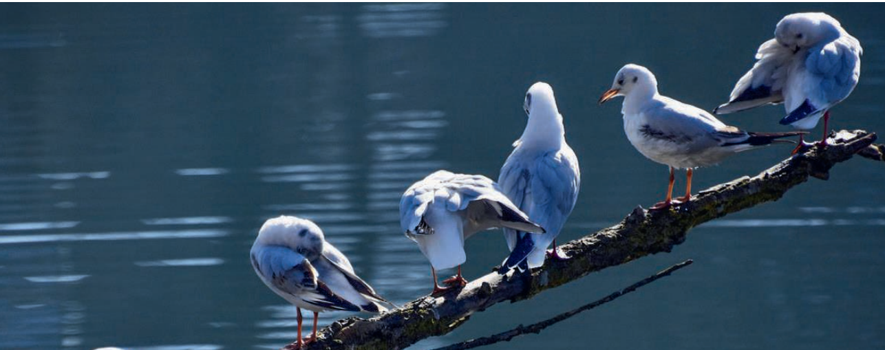
Möwen am Rotsee

M an muss die Zukunft abwarten und die Gegenwart geniessen oder ertragen.