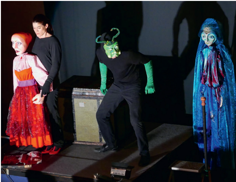
Menschengrosse Holzfiguren der Tösstaler Marionetten verleihen den Gestalten aus der «Schwarzen Spinne» Charakter.