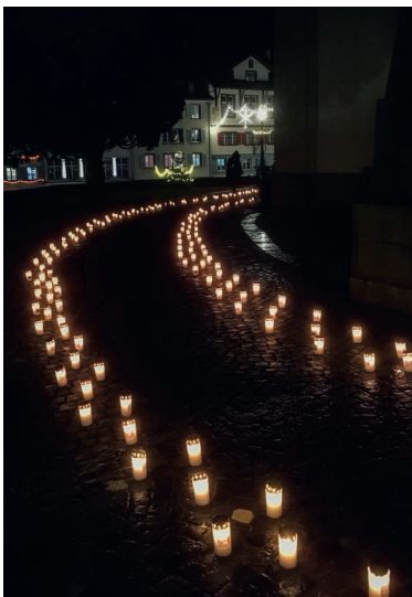
In Willisau führt ein Lichterweg in die Pfarrkirche, wo das Friedenslicht abgeholt werden kann.