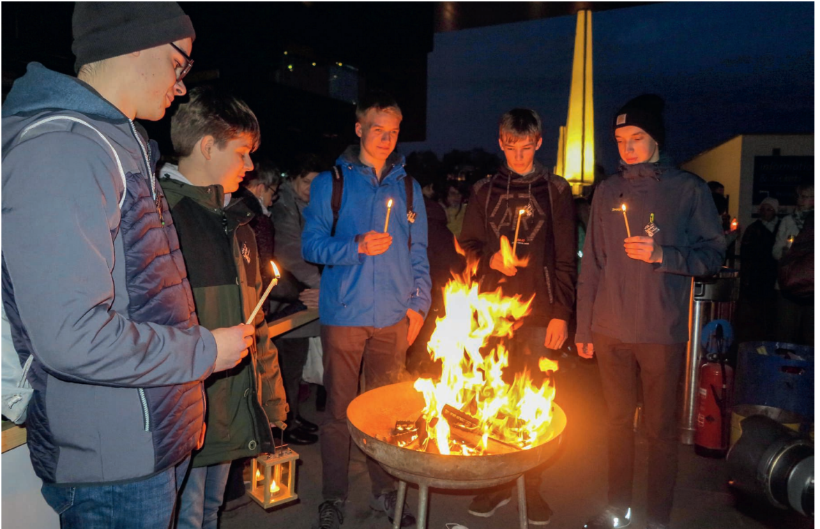
Beim KKL Luzern wird mit dem Friedenslicht ein Feuer entfacht, ehe es an die Bevölkerung weitergegeben wird.