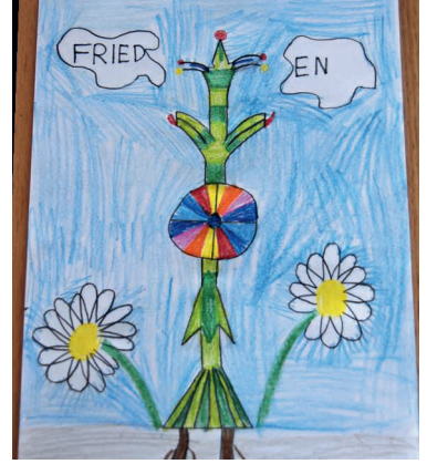
Eine Friedensblume mit zwei starken Wurzeln ist am Wachsen, am Blühen, am Sich-Ausweiten!