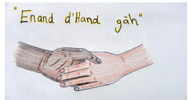
«Enand d'Hand gäh» wäre doch so einfach, dies jedoch umzusetzen, ist für viele eine zu grosse Herausforderung.