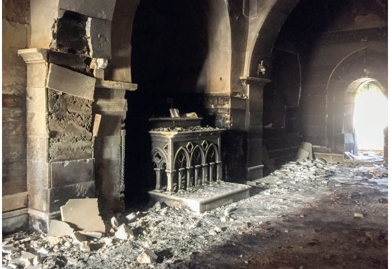
Eine zerstörte Kirche im Irak (Aufnahme von 2018).