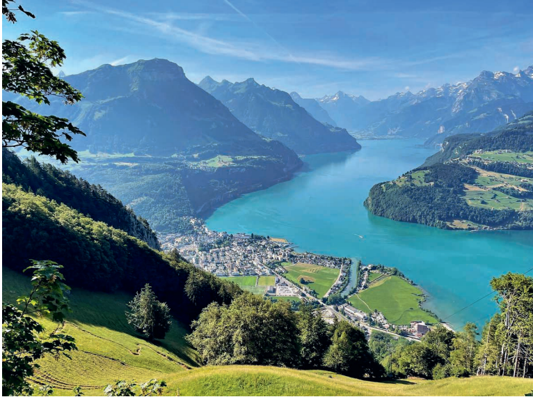
Aussicht vom Urmiberg.

Urmiberg – Gottertli – Gätterlipass – Rigi Burggeist – Unterstetten – Felsenweg – Rigi Kaltbad