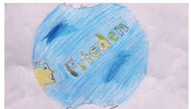
Ein Mensch haucht Frieden in die Welt.