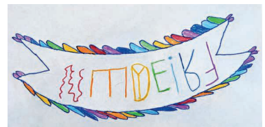
Das Wort Frieden steht bewusst auf dem Kopf und die Buchstaben sind verkehrt rum. So wie das Wort Frieden schwer zu lesen ist, so schwer zu erreichen ist manchmal auch der Friede!