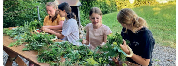
Die Schülerinnen beim Anfertigen eines Johanniskranzes.

Was hat ein auf einem Tablett servierter Kopf mit dem Johannistag am 24. Juni zu tun? Dieser Frage gingen die SchülerInnen der 2. Oberstufe an genau jenem Samstagabend nach. Die tragische Hinrichtung des Johannes des Täufers stand dabei jedoch nicht im Vordergrund, sondern vielmehr die Bedeutung des Wegbereiters Jesu in Tradition und Gegenwart. Sein Geburtstag wird exakt sechs Monate vor der Geburt Jesu gefeiert, zur Sommer Sonnenwende. Die aus der Volksfrömmigkeit entstandenen Bräuche wie das Johannisfeuer oder der Johanniskranz, der an der Haustür aufgehängt vor Unheil bewahren soll, werden vor allem in den nördlichen Ländern noch gefeiert. Die Oberstufenschüler*innen fertigten an diesem Abend ihren eigenen Johanniskranz aus Naturmaterialien und liessen so diese Tradition auch hier für einen Moment wieder aufleben. Auf dem zur Glut gewordenen Johannisfeuer wurde etwas Leckeres gebrätelt. Ein berührendes Finale fand der Abend beim Wellbergkreuz mit der Segnung der Johanniskränze durch Urs Borer und einem zauberhaften Sonnenuntergang.