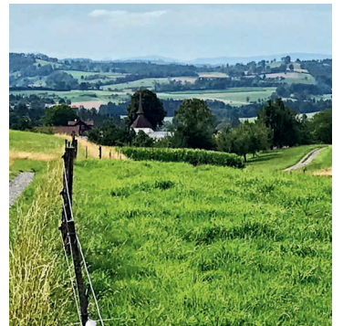
Auf dem Weg zur Kapelle St. Ulrich.

Der Anlass findet bei jeder Witterung statt.